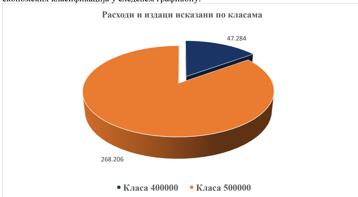
График 1. Укупни расходи и издаци приказани по класама економских класификација

Укупни расходи и издаци Управе за игре на срећу приказани су по класама економских класификација у следећем графикону.