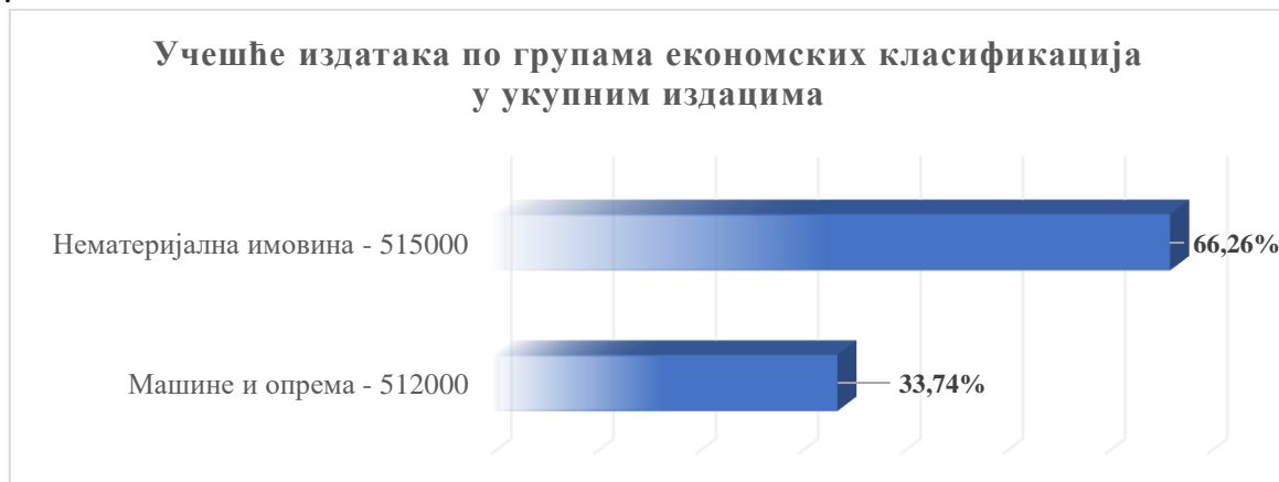
Графикон 3. Учешће издатака по групама економских класификација у укупним издацима

Учешће издатака по групама економских класификација приказано је у Графикону 3.